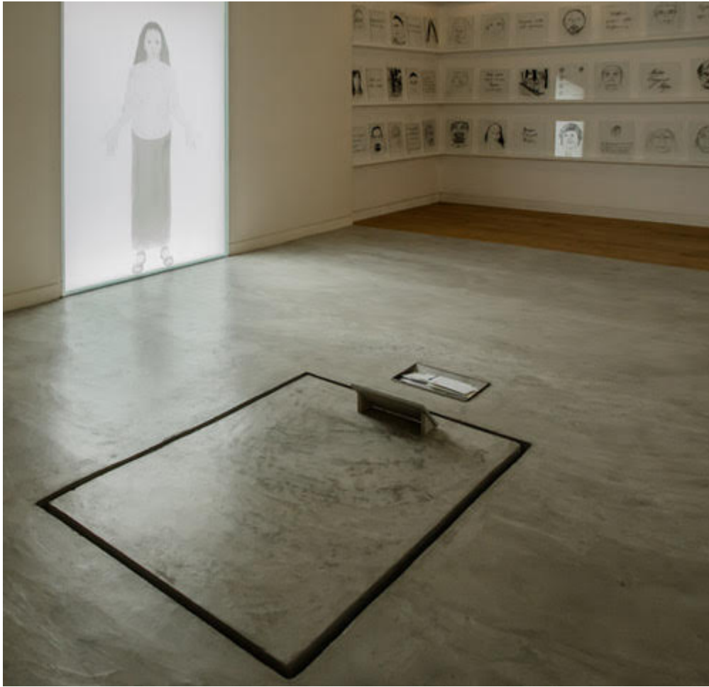
Chapelle du Père Lataste, couvent des dominicaines de Béthanie, Monferrand-le-Château